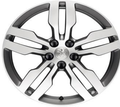
Llantas de aleación 18"