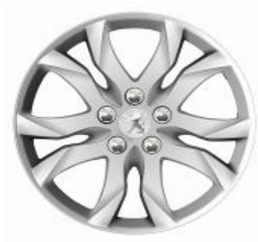
Llantas aleación 17" Allure